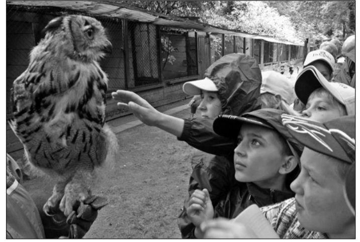
Neugierig betrachten die Tschernobylkinder den Uhu, den sie auch streicheln durften.

Alle Kinder und auch die beiden Betreuerinnen waren traurig, als der Bus sich vor der Jugendherberge in Bewegung setzte. Oxana wurde in Minsk in der Klinik abgesetzt, doch man hat die Operation verschoben, nachdem man gehört hatte, welchen Zwischenfall Oxana in der Lochmühle hatte. Der Bus erreichte ohne Zwischenfälle das 2400 Kilometer von Bad Homburg entfernte Tscharikow, wo Wala und Andrej Baranow den Transport in die Dörfer, aus denen die Kinder kommen, organisiert haben. Besonders freut sich auch der Lehrer des Werk-